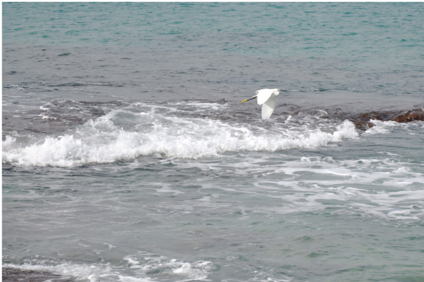
□ 戏浪图 / 曾武