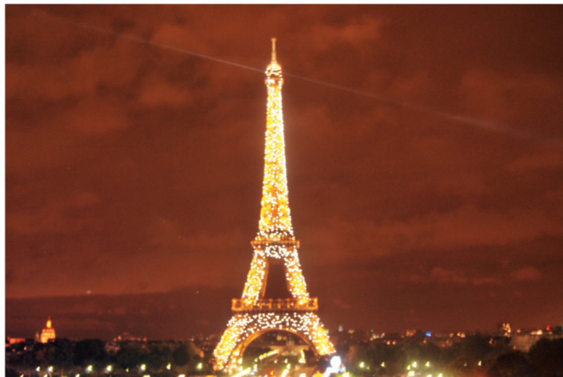
□ 印象埃菲尔 图 / 阳光