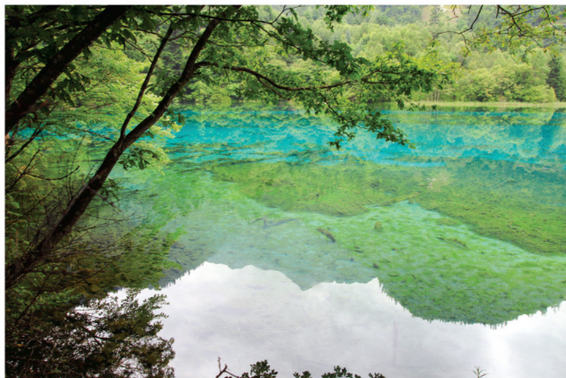
□ 层林尽染 图 / 蔡晓天