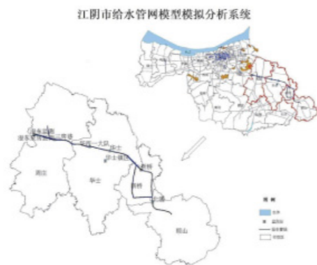
图1 某市给水管网模型研究区域及监测点分布

本文将某市给水管网中澄东加压站供水区域为研究对象，实现该平台在给定供水管网规划方案中的应用，即通过设定给水管网模型的条件和情景，由水力计算分析结果对规划方案的合理性作出全面评价。