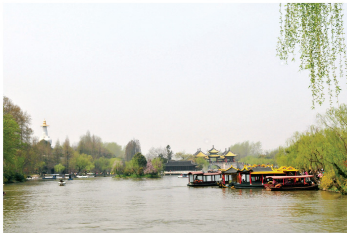
□ 岁月静好 图 / 潘丽云