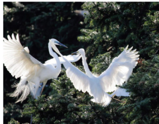
□ 鹤舞松间 图 / 逸儿