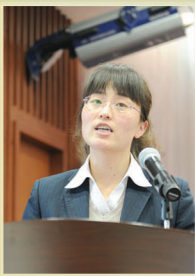
年度供水服务之星

同时,技术创新也促进了服务创新,2013年,信息中心还与其他部门密切合作,建立962001微信公众服务号,完成公司网站功能扩展,增加了水费充值卡网上充值、用水资讯投诉等服务内容,使公司的服务更贴近用户,提高了用户服务满意率。