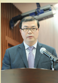
技术创新先进集体

成绩只代表过去,展望新的一年,我将戒骄戒躁,继续前行。在工作中团结同事,不断提高技能水平和突发事件处置能力,以饱满的工作热情、认真的工作态度、细致的工作方法、强烈的安全防范意识,踏实做好每一件事,充分发挥党员先锋模范作用,为水厂安全保供工作做出更大的贡献。