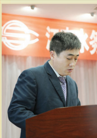
优秀共产党员代表