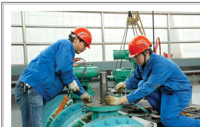
12月24日,小湾水厂早起步、早着手,提前启动2016年供水设备保养计划,打响新年安全保供第一枪。(白朝晖 张立)

况,彻底消除各类安全隐患。车辆的化油器及供油管路。查看车载灭火器状况维护保养,更换防冻液、老化软管等集中检查施工,市政工程公司有计划地对施工车辆进行12月初,为确保冬季供水管道安全、顺畅