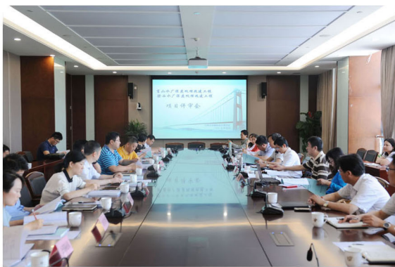
同时，与会专家讨论了施工设计图并提出了建设性意见。(张瑜 澄水)

级，继小湾水厂深度处理改造工程后，公司加大投入，拟在肖山水厂、澄西水厂实施供水工艺深度处理改造。评审会上，工程设计方上海市政院详细解读了项目可研报告，与会专家及政府各部门代表进行深入、细致、热烈的交流，对该项目的意义给予了高度肯定。在严谨的技术实验数据面前，一致认为针对长江水源的水质特性，项目采用臭氧—活性炭深度处理工艺是最有