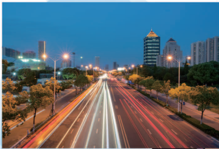
一等奖 肖山水厂 顾敏 / 《城市家园》