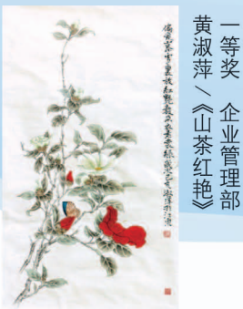
一等奖 企业管理部 黄淑萍 / 《山茶红艳》