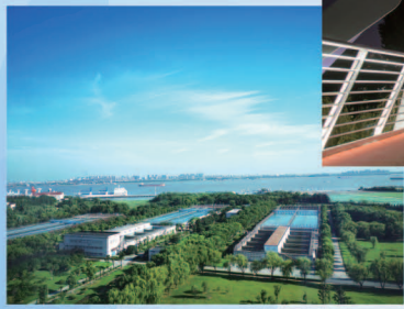
二等奖 风险管理部 刘彤 / 《盛夏的水厂》