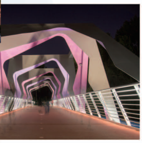
二等奖 生技部 陆蓉 / 《光影绿道》