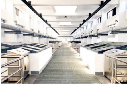
小湾水厂深度处理活性炭滤池

2020年1月份检测中心圆满完成国家实验室认可(CNAS)现场评审和扩项工作，水质检测能力186项，其中GB5749-2006《生活饮用水卫生标准》106项、GB3838-2002《地表水环境质量标准》100项、水处理物质氯化铁和聚合氯化铝、次氯酸钠以及滤料33项。