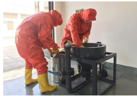
高锰酸钾投加应急演练

为提高应对各类突发生产安全事故的能力，控制和减少事故危害，最大限度减少职工伤亡和财产损失，公司持续强化应急救援能力建设，不断完善《江阴市城市供排水突发事件应急预案》，开展应急演练实习，提升员工的应急实战能力。2020 年，公司先后开展了长江原水突发污染应急启用地下备用水源应急处置、有限空间作业管