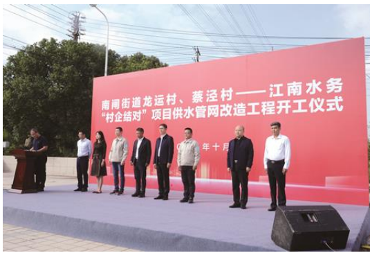
南闸供水管网改造工程开工仪式

展同奔现代化”精准扶贫行动，助力推进以改善民生为重点的乡村建设。2020年，公司对经济薄弱村华士陆南村完善公共设施建设等方面提供资金10万元。为南闸龙运村、蔡泾村改造供水管网，解决两村1000余户居民、4000余名群众的饮用水安全问题，减轻了村级支出的沉重负担，让村民享受到了村企共建、精准扶贫的幸福果实。