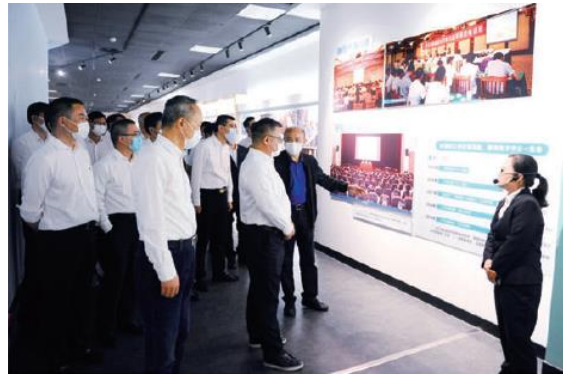
公司党委赴华西村参观学习

公司通过组织召开“弘扬先进再出发、不负韶华绘蓝图”庆祝建党 99 周年暨半年度总结表彰大会、“以青春之我、创青春水务”五四青年节主题团课活动、“学习贯彻新思想庆祝建党 100 周年”网络知识竞赛、“守初心树新风，学新华西共发展”参观学习活动、与市水利局开展“党建聚合力、共建促发展”主题活动等一系列党建