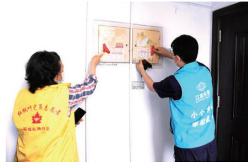
志愿者清除楼道小广告

开展以“党建引领聚合力情满中秋志愿行”等主题党建志愿活动，“小水滴”志愿者为结对村里的困难群众带去了节日的祝福，并为他们检查水管、维修水阀、安装水龙头等，真正打通宣传群众、关心群众、服务群众的“最后一公里”。