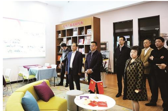
“七五”普法考核组检查现场

自普法工作开展以来，公司紧扣安全保供中心工作，将依法治企贯穿至企业管理运行之中，将普法宣传深入到企业干部职工及广大用户，着力搭建牢固的企业法治建设堡垒，营造和谐的企业法治文化氛围。公司开展每月学法活动，旨在进一步增强广大党员干部法治意识和责任意识，提高依法行政能力。通过建立和完善领导干部集体学法、法制讲座、法律培训等制度，扎实推动党员干部学法用法，使依法治企行之有效，普法宣传纵深推进。公司将宪法和民法典的学习宣传贯彻作为重点任务，探索形成科学有效、独具特色的法治宣传模式。