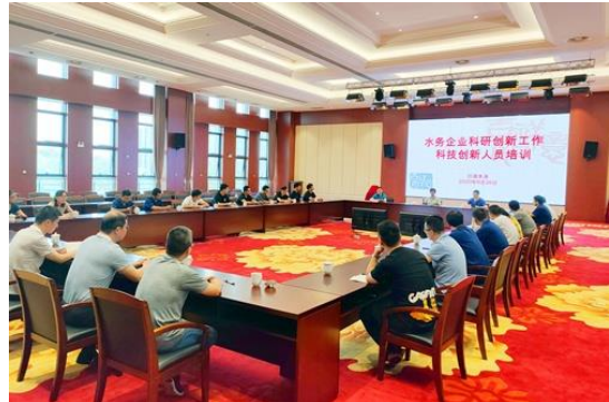
科技创新工作专题培训会

为进一步营造浓厚科创氛围，激发科技创新活力，发挥工程研究中心科创引领作用，形成科创规划思路，谋求新的突破，实现新的发展，公司积极开展各项科研项目，依据《科技创新项目管理办法》，鼓励员工积极投身创新研发；通过工程研究中心、江南水务智慧水务研究院等科技创新平台，开展了项目开发、科研人员培训等工作；邀请专家进行“水务企业科技创新工作”主题讲座；邀请倒流防止器、臭氧发生器厂家技术人员来司进行技术交流。今年公司新增 3 个研发项目，分别为“江阴市小区高品质供水工艺选择研究”、“聚合氯化铝盐基度对出厂水铝的分析研究”和“智能控制模块的产品化研发”，共有 3 个项目通过验收评审，其中“钢管不规则端面的切割坡口装置”、“炭砂滤池的应用研究”已开始推广应用，取得了较好的效果。